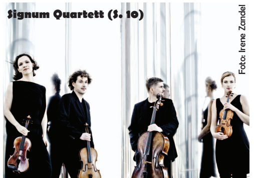
Signum Quartett (§. 10)