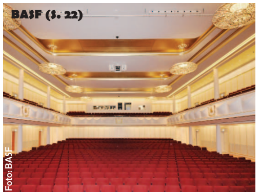
BASF (§. 22)