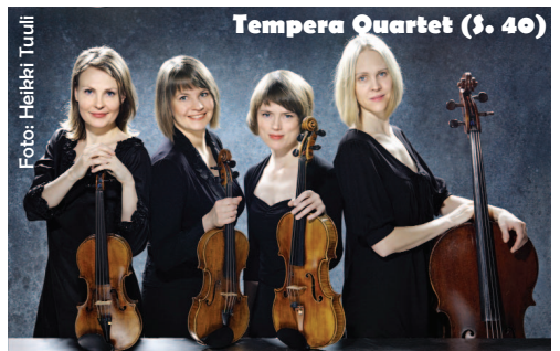
Tempera Quartet (§. 40)