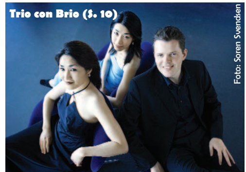
Trio con Brio ($ 10)

Amar Quartett Die Hindemith-Versteher 40