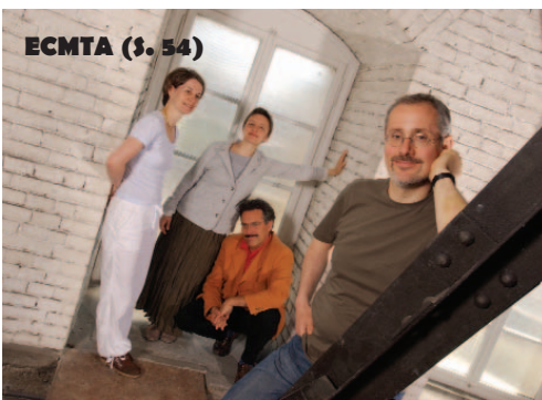
ECMTA (S. 54)