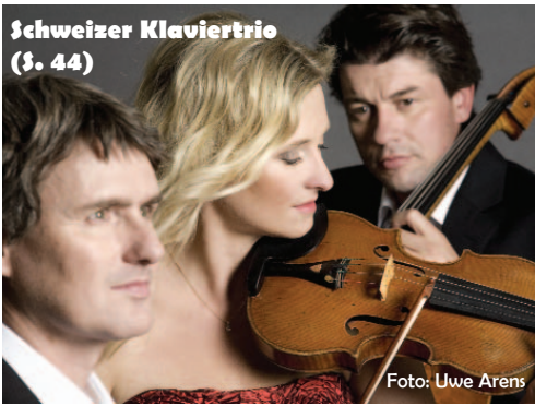
Schweizer Klaviertrio (S. 44)