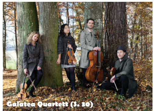
Galatea Quartett ($ 30)