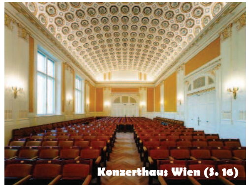
Konzerthaus Wien ($ 16)