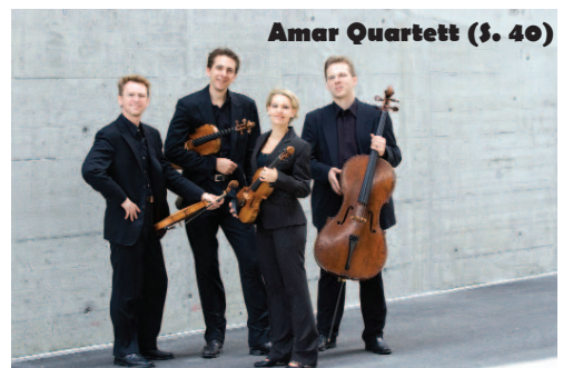
Amar Quartett ($ 40)