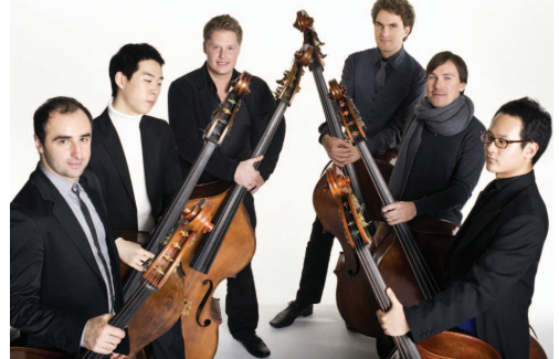
Bassona Amorosa ($ 22)